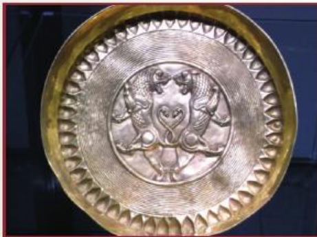
بشقاب زرین Gold plate