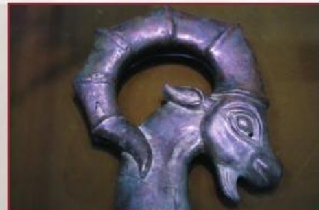
سر بز کوهی Head of an Ibex