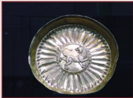
بشقاب زرین Gold plate