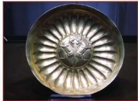
بشقاب زرین Gold plate