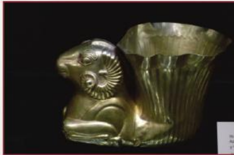
جام زرین - دوره هخامنشی (سده ۴-۵ پیش از میلاد) Gold Rhyton - Achaemenian , 5th to 4th Cent.B.C