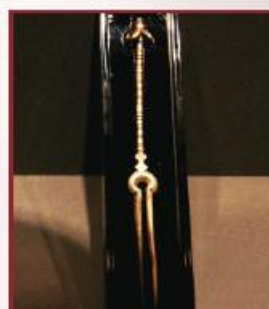
قاشق و چنگال Spoon and Fork