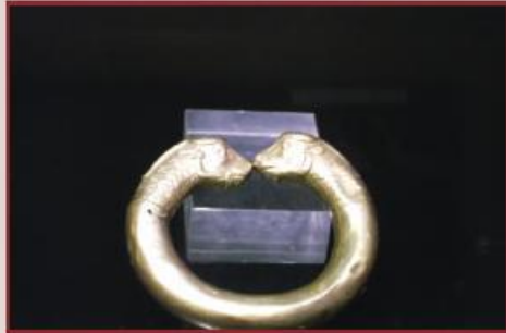
بازوبند طلا Gold Armlet