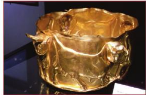
جام زرین Gold Rhyton