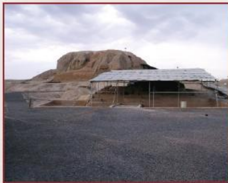
Reconstructed Image of Sialk Ziggurat