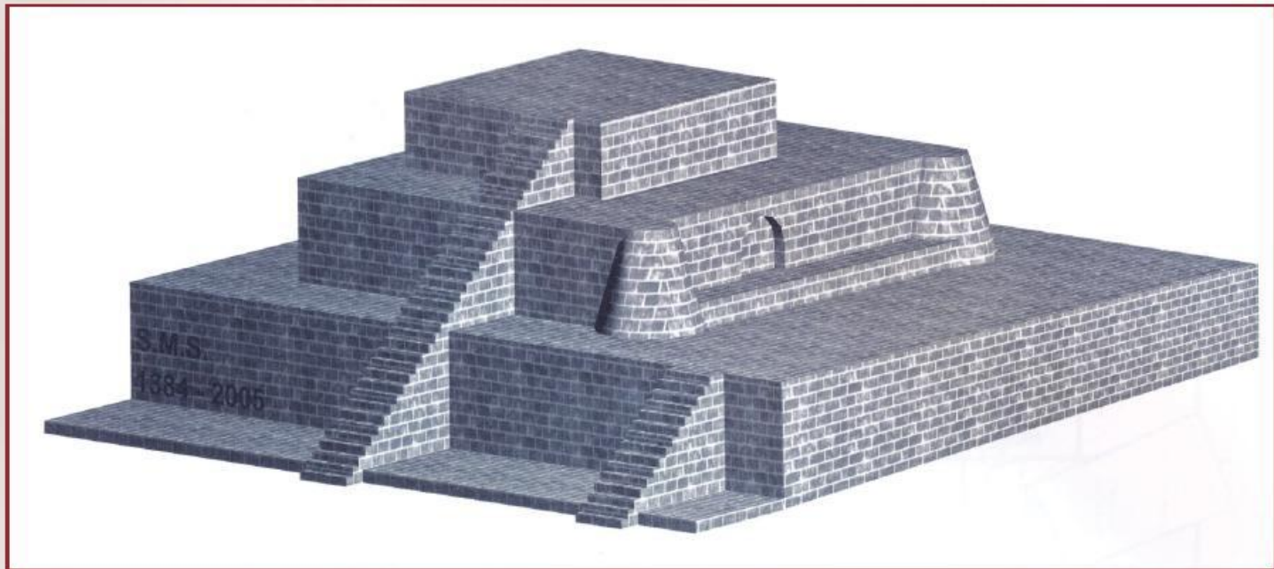
تصویر بازسازی شده زیگورات سیلک