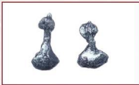
دو مهره کوچک مسی پس از زنگارگیری و حفاظت Two small copper tokens after cleaning and preservation