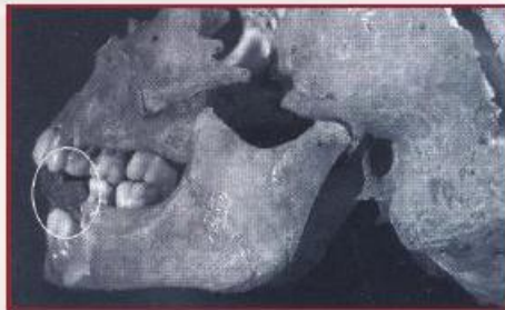
دو مهره مسی در میان دندانها Two small copper tokens applied between the teeth